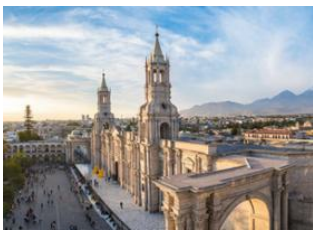
Lima 📍 ✈️ - ⌚ 1h 30m Arequipa 📍