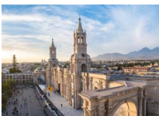
Lima ✈ - ⌚ 1h 30m Arequipa