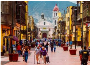
Puerto Maldonado 📍