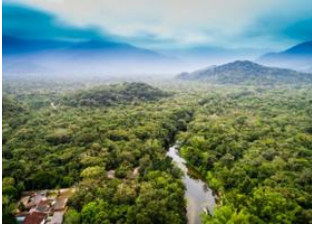
Puerto Maldonado 📍