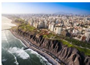
Mancora 📍 ✈️ - ⌚ 1h 40m Lima 📍