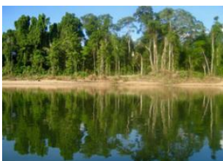
Puerto Maldonado 📍