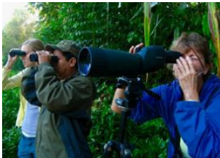
Puerto Maldonado 📍