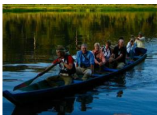
Lima 📍 ✈️ - ⌚ 1h 30m Puerto Maldonado 📍