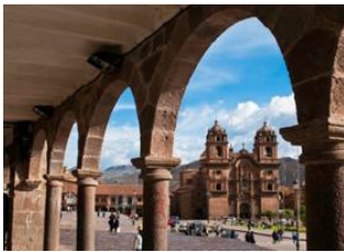
Puerto Maldonado 📍 ✈️ - ⌚ 1h Cusco 📍